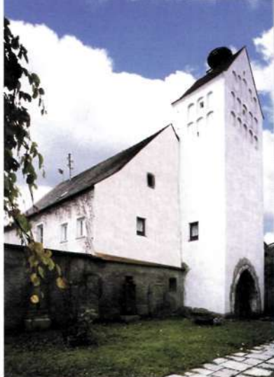
Schwedenturm mit Gemeindehaus

Gemeinde zum 1. Mal die Feier der Goldenen Konfirmation, seit 1940 auch die Silberne Konfirmation. Dankbar gedenken an solchen Tagen die Jubilare des Segens, den Gott sie in ihrem Leben hat erfahren lassen. Jeder Blick in die Vergangenheit möge auch uns immer wieder mahnen, das geistige und geistliche Erbe zu wahren, das unsere Väter uns bei aller Not und unter mancherlei Anfechtung in Treue bewahrt haben.