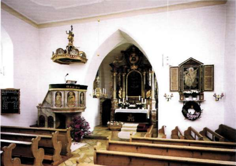
Innenansicht der Nikolauskirche Kohlberg

Die Westwand der Kirche nimmt in der ganzen Breite die Orgelempore ein, auf der seit 1923 eine neue Orgel steht. Die alte Orgel, im Jahr 1751 von Johann Konrad Funtsch in Amberg gefertigt und mit 8 Registern ausgestattet, wurde, außer dem Prospekt, 1917 als völlig unbrauchbar abgebrochen. 1923 wurde eine neue Orgel von der Firma Georg Holländer, Feuchtwangen, in das erweiterte Gehäuse eingebaut. 1979 erhielt die Orgel ein neues Pfeifwerk von der Orgelfirma Walcker.