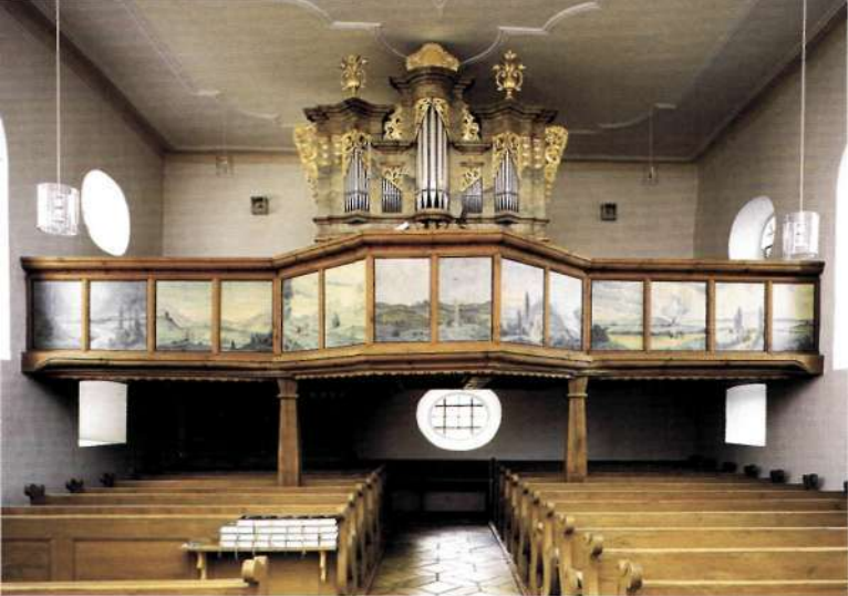
Rückansicht mit dem Orgelprospekt aus dem Jahre 1751

den und auf den Turm. An der Südwand des Kirchenschiffes steht über dem Eingang eine Statue des heiligen Nikolaus, die bis zur Lösung des Simultaneums links auf dem Bogen über dem Umgang um den Altar stand. An der Südwand befand sich auch bis 1922 die Kanzel, die heute an der nördlichen Hälfte der Ostwand neben dem Durchbruch zum Chor steht und mit einem reich verzierten Deckel, der von einer Statue des auferstandenen „Siegesfürsten“ gekrönt wird, versehen ist.