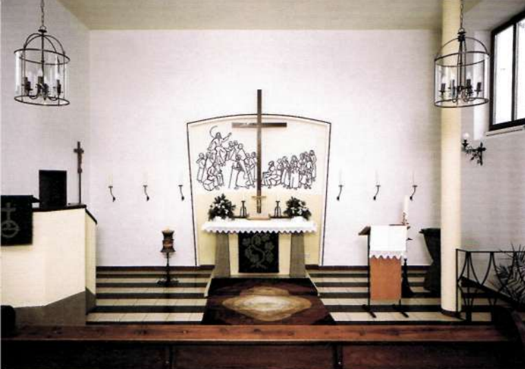
Innenansicht der Kreuzkirche Weiherhammer